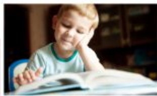
يبدأ والدي يومه بقراءة الصحيفة.