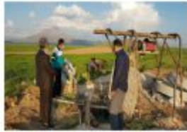
استخرج الفلاحون ماءً من البئر للزراعة.