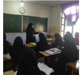
الطلاب جالسوا أمام المدرّسة.