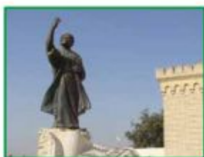
تمثالُ العلماءِ، في مَدِينَةِ بَغدَادِ.