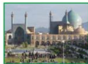
مَسْجِدُ الْإِمَامِ، أَتْرُ قَدِيمٌ فِي مُحَافَظَةِ إِسْفَهَانَ.