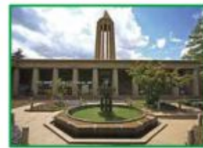
مَرَقْدُ الْعَالِمِ الْإِيرَانِيِّ ابْنِ سِينَا فِي مَدِينَةِ هَمْدَان.