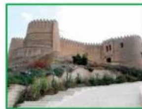
هذه قلعةٌ تاريخيةٌ في محافظة جميلةٍ.