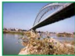
الْجِسْرُ الْأَبْيَضُ، عَلَى نَهْرِ كَارُون.