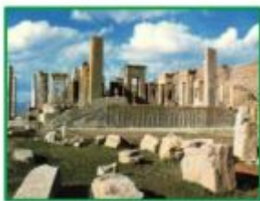
هذا أثرٌ تاريخيٌّ في محافظة كِبيرةٍ.

۹- با توجه به ترکیب‌های وصفی و اضافی جملات زیر را ترجمه کنید.