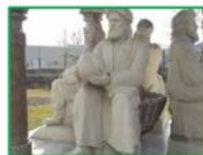
تمثالُ العلماءِ، في مَقَرِّ مَنظَمَةِ الأُمَمِ المُنْتَدَةِ.