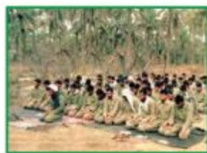
جُنُودُنَا الْأَقْوِيَاءُ، جُنُودٌ مُؤْمِنُونَ.