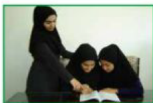
ابحثنا عن الجواب في الكتاب.