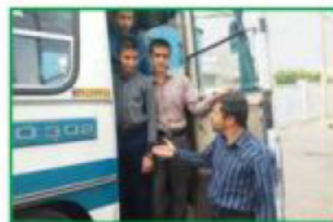
رجاء، انزلوا من الحافلة.