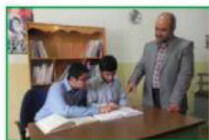
ابحثنا عن الجواب في الكتاب.