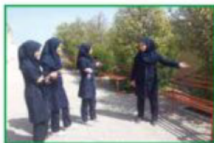
رجاء، اجلسن هناک.

۲۹- فِعلُ الأَمْرِ (۲) (یا أولادُ، اُفعلوا)، (یا بناتُ، اُفعلنَ) (یا ولدانِ، اُفعلوا)، (یا بنتانِ، اُفعلنا)